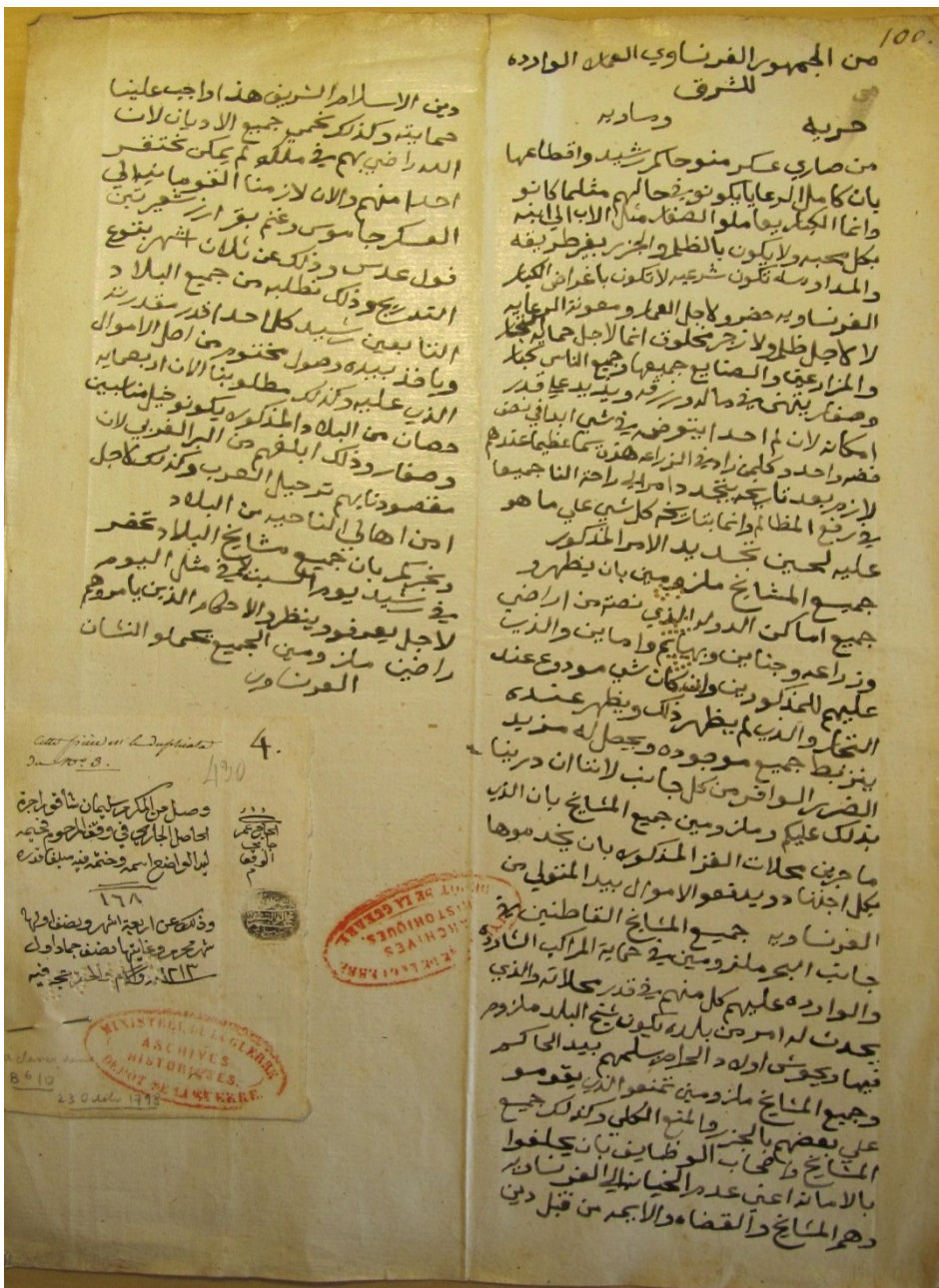
الوثيقة الثالثة: وثيقة رقم B6 15 (0183-0147) بتاريخ 23 اكتوبر 1798